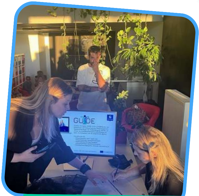
Griechenland, 21. Oktober 2025

Die griechische Multiplikator*innenveranstaltung, die am 21. Oktober 2025 in Patras stattfand, brachte Lehrkräfte, Berufsberater*innen und andere interessierte Fachleute zusammen, um inklusive Ansätze in der Berufsberatung zu erörtern. Unter dem Titel „Gendersensible Ansätze in der Berufsberatung“ setzten sich die Teilnehmenden mit den im Projekt entwickelten Tools und Materialien auseinander und diskutierten, wie diese zur Gleichstellung in der täglichen Beratungspraxis beitragen können.