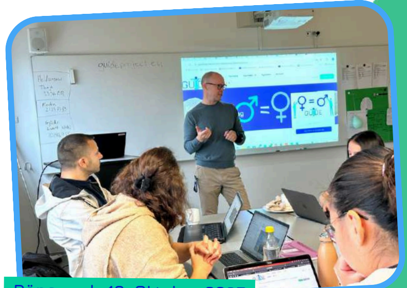
Dänemark, 10. Oktober 2025

Die dänische Multiplikator*innenveranstaltung fand am 10. Oktober 2025 bei SOSU Østjylland in Aarhus statt und wurde von 21 Teilnehmer*innen besucht. Ihnen wurde der E-Learning-Kurs und das GSCG-Toolkit vorgestellt. Gleichzeitig haben Sie selbst praktische Übungen durchgeführt bei denen Sie im Projekt entwickelte Tools kennenlernen konnten.