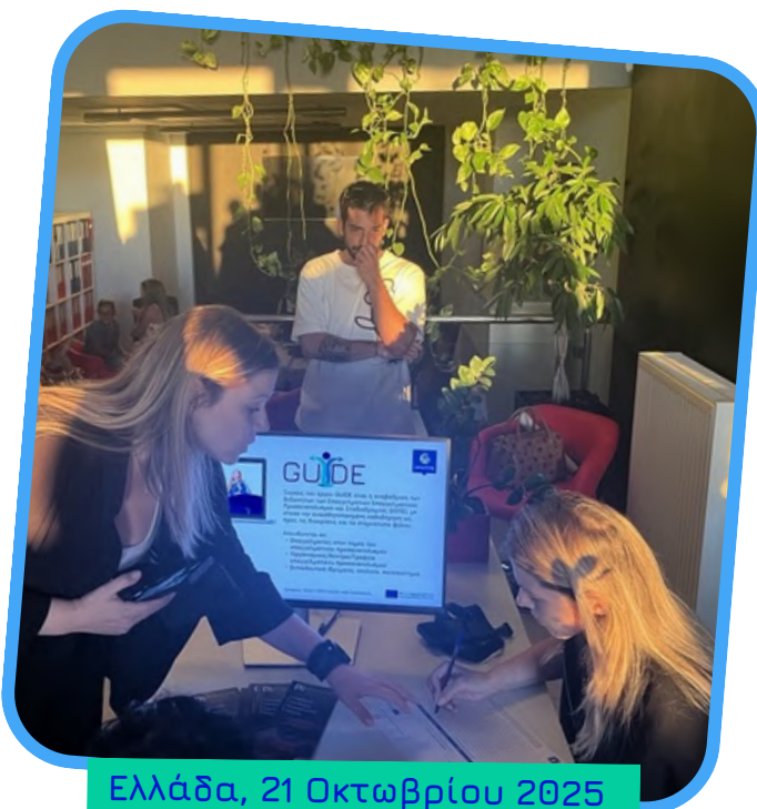
Ελλάδα, 21 Οκτωβρίου 2025

Η εκδήλωση στην Ελλάδα, που πραγματοποιήθηκε στην Πάτρα στις 21 Οκτωβρίου 2025, συγκέντρωσε εκπαιδευτές, συμβούλους και επαγγελματίες με σκοπό την εξερεύνηση προσεγγίσεων χωρίς αποκλεισμούς στον τομέα του επαγγελματικού προσανατολισμού. Με τίτλο «Προσεγγίσεις με ευαισθητοποίηση ως προς το φύλο στον επαγγελματικό προσανατολισμό», οι συμμετέχοντες ασχολήθηκαν με τα τελικά εργαλεία του έργου – το online μάθημα και την εργαλειοθήκη GSCG – και συζήτησαν τον τρόπο με τον οποίο αυτά μπορούν να υποστηρίξουν την ισότητα στην καθημερινή πρακτική της παροχής συμβουλών.