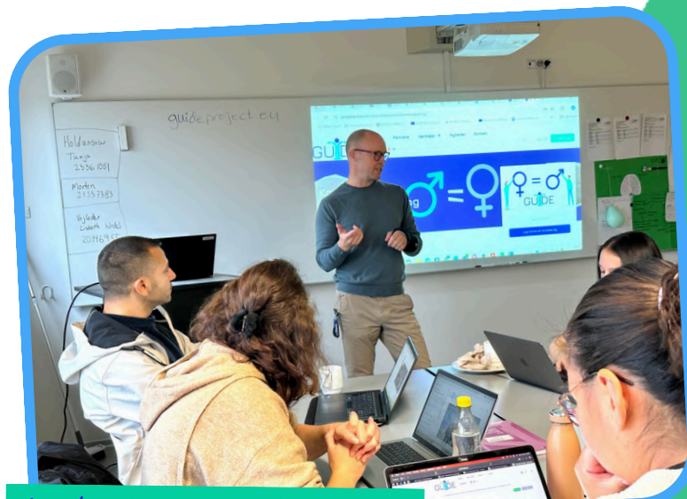
Δανία, 10 Οκτωβρίου 2025

Η ενημερωτική εκδήλωση της Δανίας πραγματοποιήθηκε στις 10 Οκτωβρίου 2025 από τη SOSU Østjylland στο Aarhus , συγκεντρώνοντας 21 συμμετέχοντες για να εξοικειωθούν με τα αποτελέσματα του έργου. Οι συμμετέχοντες/ουσες ενημερώθηκαν για το online εκπαιδευτικό πρόγραμμα του GUIDE , την εργαλειοθήκη GSCG και συμμετείχαν σε πρακτικές συνεδρίες χρησιμοποιώντας τα εργαλεία συν-δημιουργίας και λήψης αποφάσεων του έργου, για τον επαγγελματικό προσανατολισμό.