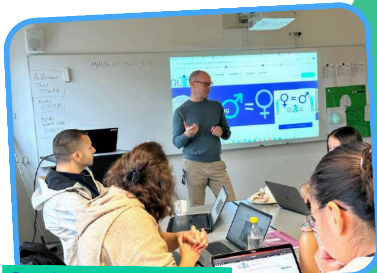
Danska, 10 oktober 2025

Danski zaključni dogodek je potekal 10. oktobra 2025 na univerzi SOSU Østjylland v Aarhusu in zbral 21 udeleženk in udeležencev, ki so raziskovali rezultate projekta. Spoznali so spletni tečaj GUIDE ter zbirko orodij ter se vključili v praktično delavnico uporabe soustvarjalnega modela svetovanja ter dialogskih kartic.