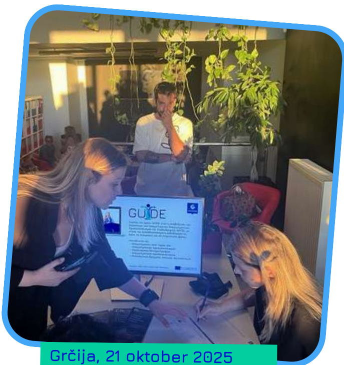
Grčija, 21 oktober 2025

Grški zaključni dogodek je 21. oktobra 2025 v Patrasu združil strokovnjakinje in strokovnjake s področja izobraževanja in kariernega svetovanja , ki jih zanima, kako v prakso vključevati načela enakosti spolov. Dogodek z naslovom Spolno občutljivi pristopi v kariernem svetovanju je ponudil priložnost za poglobljeno spoznavanje končnih rezultatov projekta – spletnega tečaja in zbirke orodij – ter za razmislek o tem, kako lahko ta orodja prispevajo k bolj vključujoči in pravični svetovalni praksi.